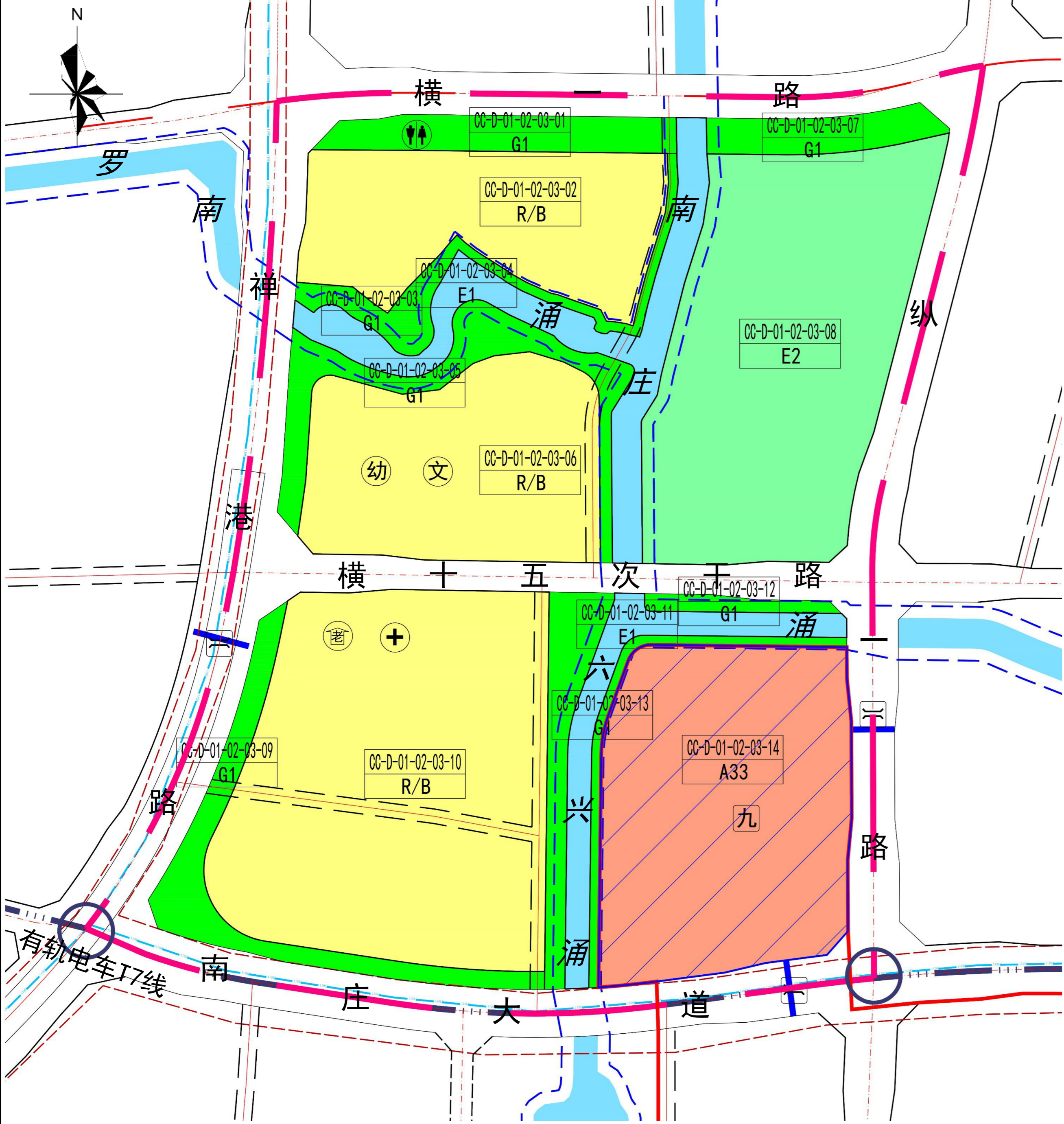
调整前土地利用规划图