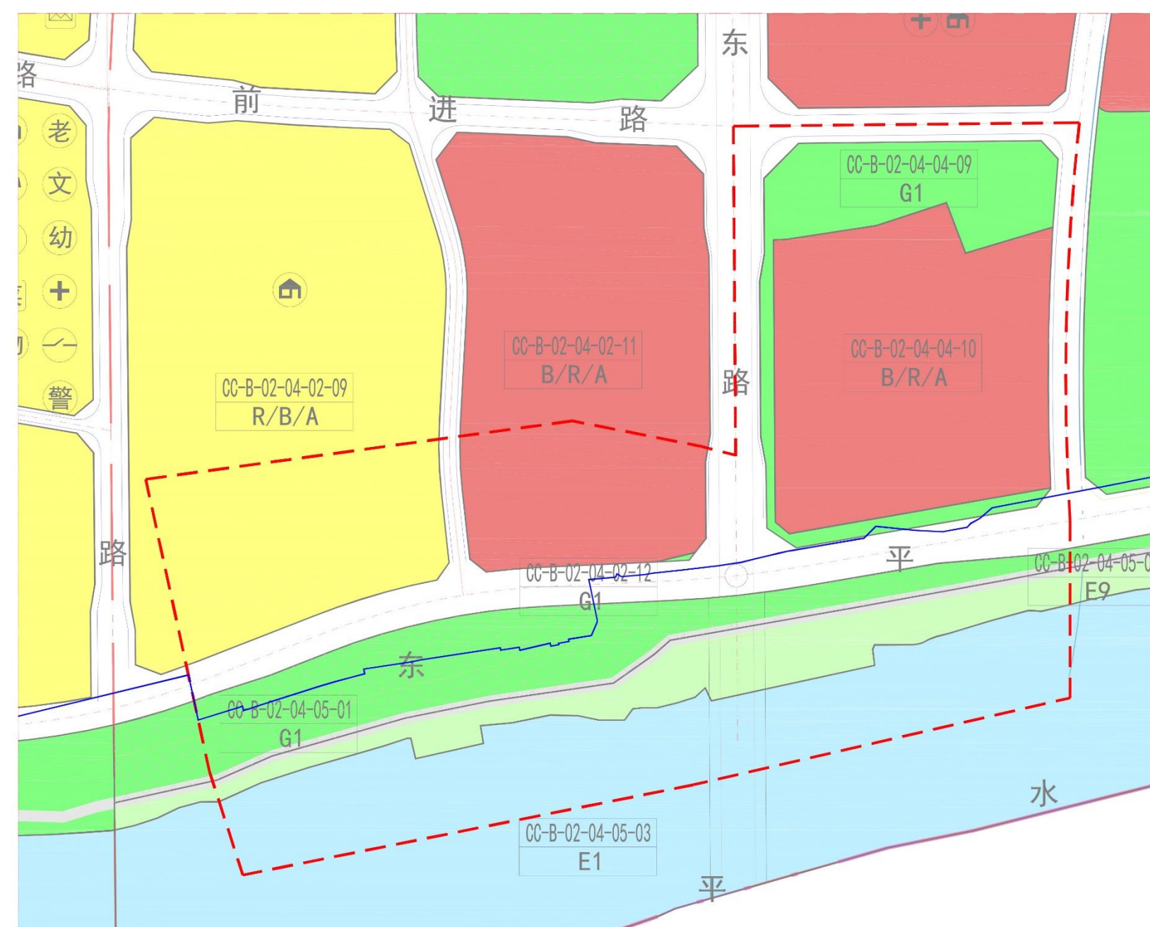
调整后蓝线与已批控规用地关系图

根据《佛山市中心城区控制性详细规划整合规划（一期）动态维护》已批控规的土地利用规划方案，在调整后的城市蓝线范围内，主要的用地功能为非建设用地（E）、城市道路用地（S1）或绿地与广场用地（G），基本满足《蓝线规划》建设用地管控要求。