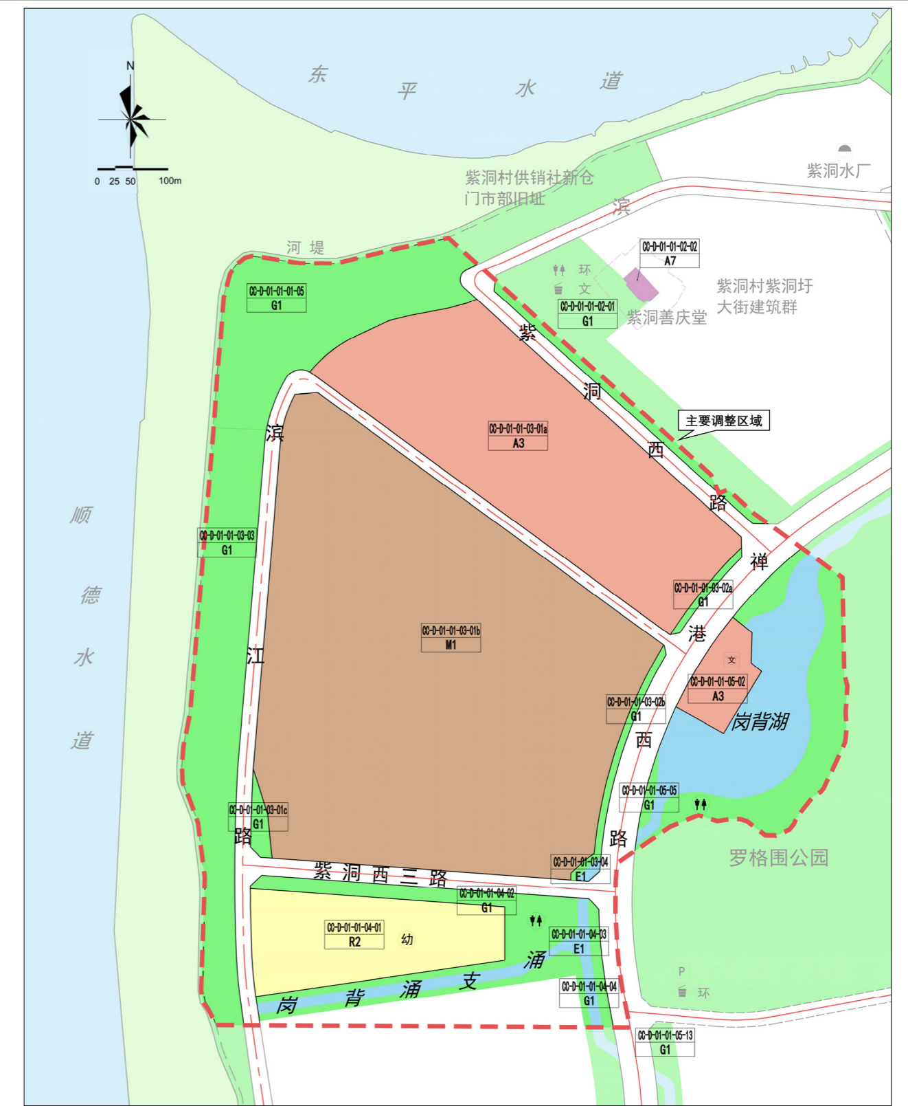
调整后规划示意图