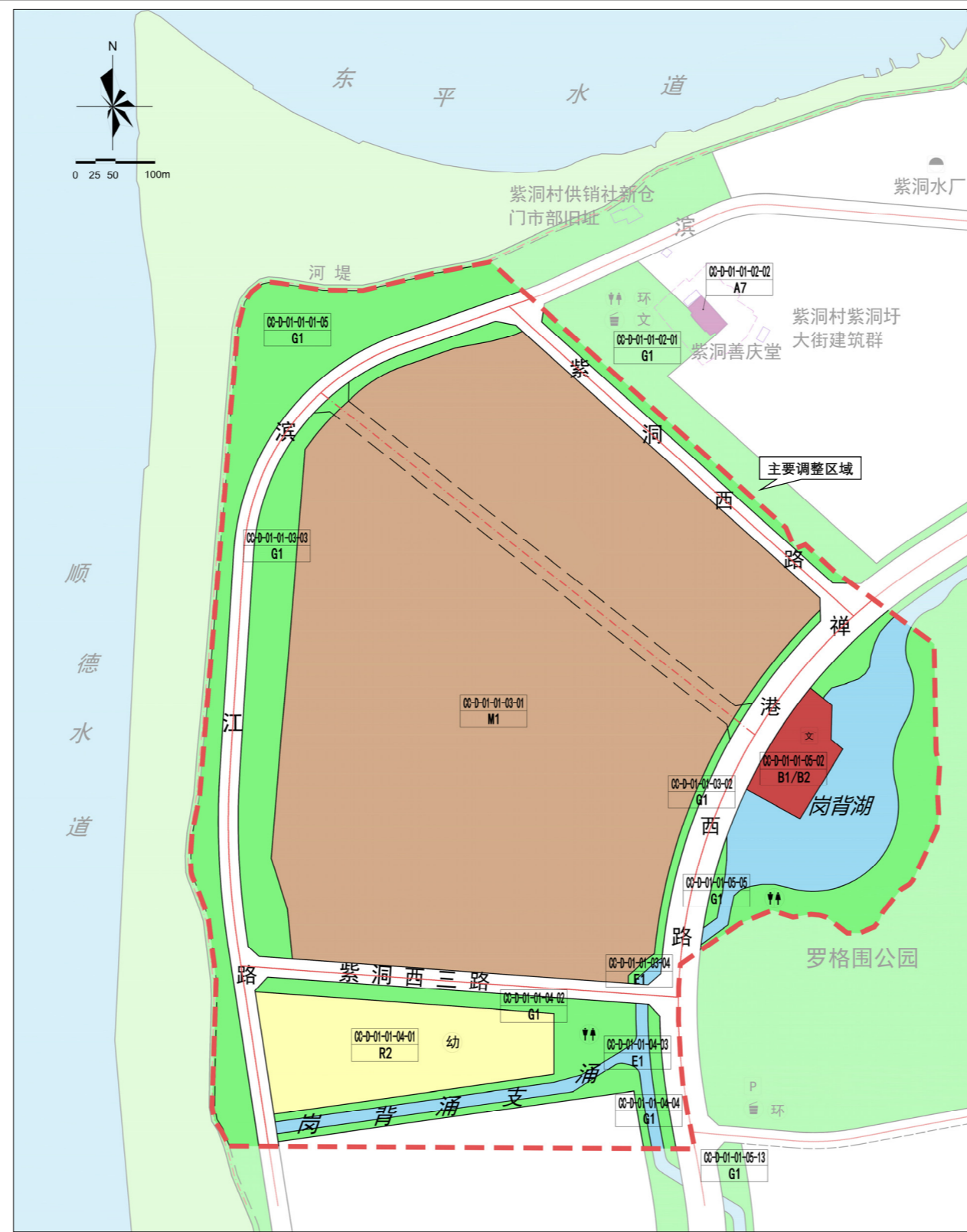
调整前规划示意图

根据《佛山市控制性详细规划制度改革与创新成果》中的相关编制程序，现将该局部调整的规划主要内容进行公示，向社会及利害关系人广泛征求意见。